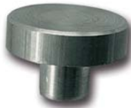
BASSETTA OTTONE (ø a richiesta) BASE IN BRASS (ø on request)