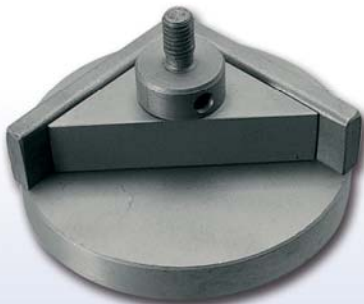
STAMPO PER ANGOLINI (tipo fisso) TOOL FOR FIXING CORNERS (Fix type)