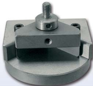
STAMPO PER ANGOLINI (tipo regolabile) TOOL FOR FIXING CORNERS (Adjustable type)