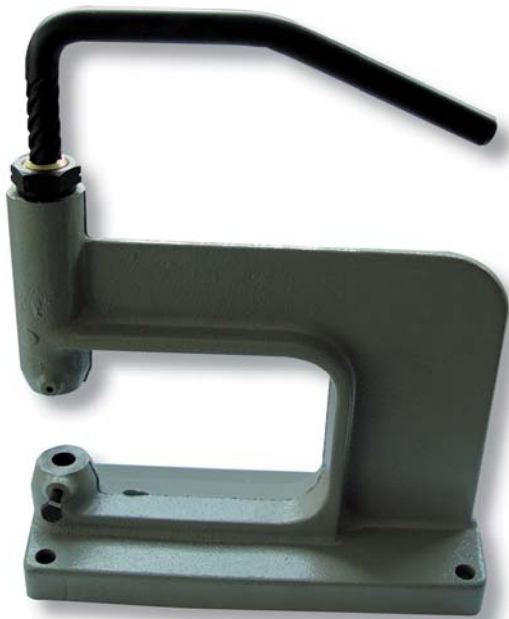
TORCHIETTO S 2 (a richiesta)