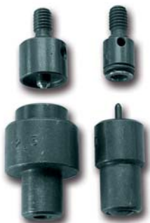
SERIE PUNZONI PER BOTTONI A PRESSIONE SET OF TOOL FOR FIXING PRESS BOTTOM