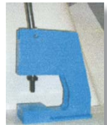
RIV 6 - 145