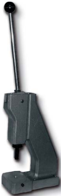
RIV 1 (a richiesta/on request)