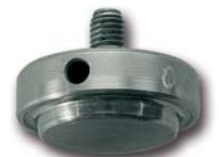
STAMPO PER OCCHIELLI TIPO (ART. 915 ÷ 935 ÷ 936) TOOL FOR EYELETS (ITEM 915 ÷ 935 ÷ 936)